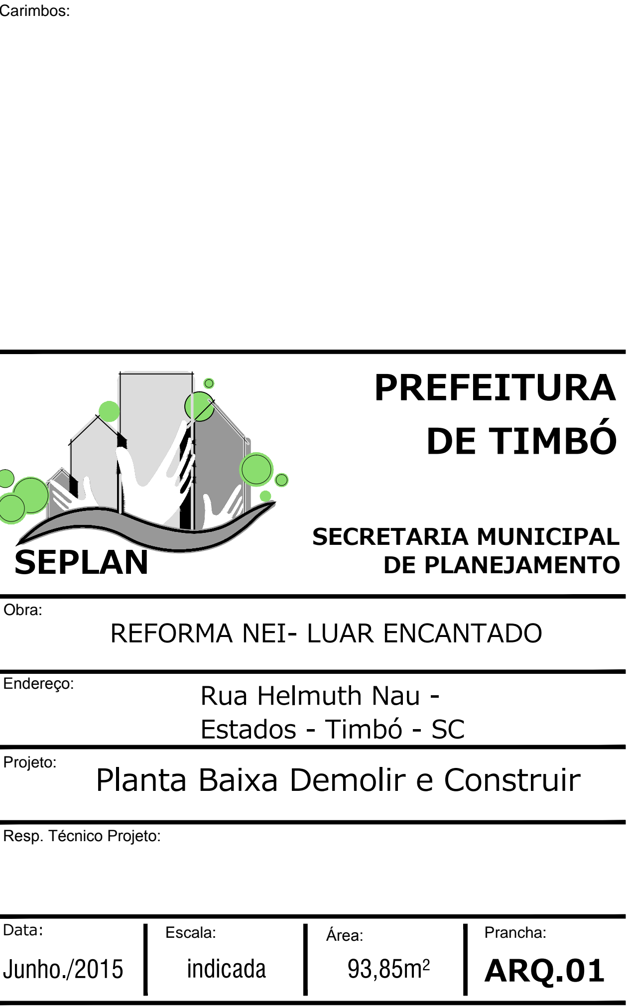
PLANTA BAIXA A DEMOLIR ESCALA .....1:50

OBS: - APÓS A RETIRADA DA CERÂMICA, DEVERÁ SER REGULARIZADA A BASE.